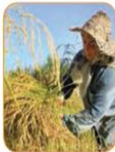
أَنْتِ فَلَاحَةٌ مُجِدَّةٌ. تَحْصُدِينَ الرُّزَّ.