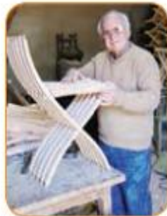
أَنَا نَجَارٌ. سَأَصْنَعُ كُرْسِيًا خَشَبِيًّا.

● جمله‌های زیر را با توجه به تصویر ترجمه کنید.