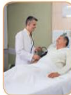
أَنْتِ طَبِيبٌ مُجِدٌّ. تَفْحَصُ الْمَرْضَى.