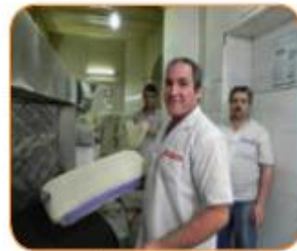
أَنَا مُدْرِسَةُ الْكِيْمِيَاءِ. أَسْرُخُ الدَّرْسَ لِلطَّلَابَاتِ. أَنَا خَبَّازٌ. أَطْبِخُ الْخُبْزَ مِنَ السَّاعَةِ الْخَامِسَةِ صَبَاحًا.

من نانواهستم از ساعت ۵ صبح نان می پزم من معلم شیمی هستم. درس را برای دانش آموزها شرح می دهم.