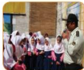
أَنْتِ طَبِيبَةٌ. تَفْحَصِينَ الْمَرِيضَى بِدِقَّةٍ. أَنْتِ شُرْطِيٌّ. تَحْفَظُ الْأَمْنَ فِي الْبِلَادِ.

تو دکتر هستی. بیماران را به دقت معاینه می کنی. تو پلیس هستی. امنیت را در شهرها حفظ می کنی.