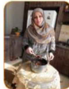
أَنَا طَبَاخَةٌ. سَأَطْبِخُ طَعَامًا لَدِينَا.

من آشپز هستم. غذای خوشمزه ای می خواهم پزم