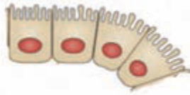
سلول‌های رود باریک