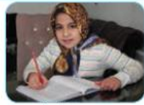
اَنَا اَكْتُبُ بِالْقَلَمِ الْاَحْمَرِ.

الفِعْلُ الْمُضَارِعُ ( اَفْعَلُ )، ( تَفْعَلُ ، تَفْعَلِيْنَ )