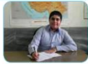
اَنَا اَكْتُبُ بِالْقَلَمِ الْاَسْوَدِ.