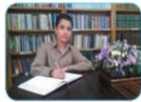
فعل مضارع (۱)

الفِعْلُ الْمُضَارِعُ ( اَفْعَلُ )، ( تَفْعَلُ ، تَفْعَلِيْنَ )