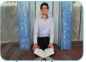
اَنْتَ تَحْفَظُ الْقُرْآنَ جَيِّدًا.

تو قرآن را به خوبی حفظ می کنی ..... تو قرآن را به خوبی حفظ می کنی