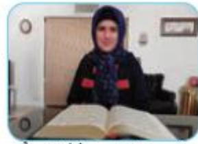
اَنْتِ تَحْفَظِيْنَ الْقُرْآنَ بِدِقَّةٍ.